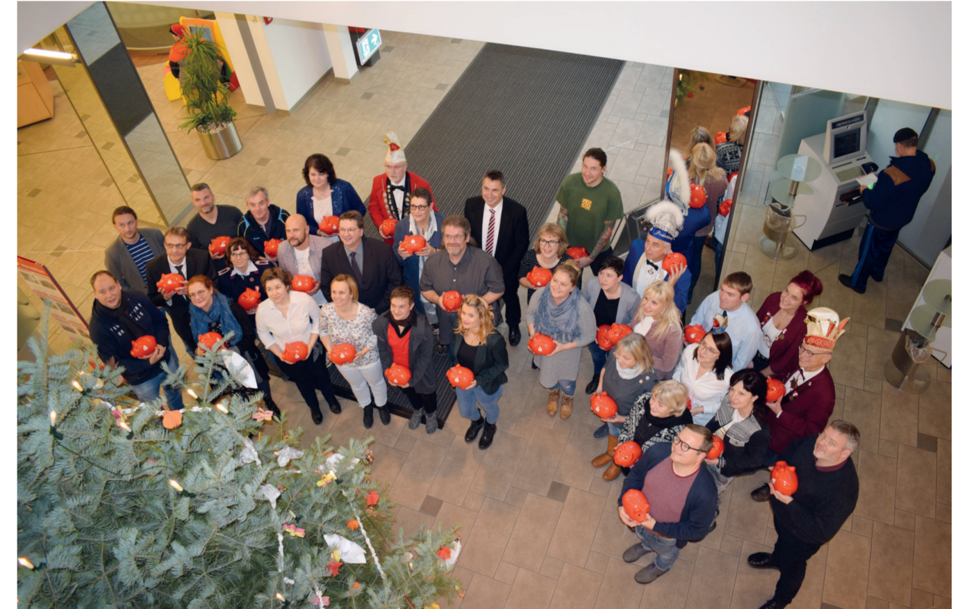
Gewinnübergabe an die 30 Vereine

Vereinsinitiative 2019: Mit der Aktion „Gut VEREINT in die Zukunft.“ stellten wir 30.000 Euro für Vereinsprojekte zugunsten der Kinder- und Jugendarbeit zur Verfügung. 65 Vereine nahmen die Möglichkeit wahr, um ihre Projekte vorzustellen und sich dem Votum unserer Kunden zu stellen.